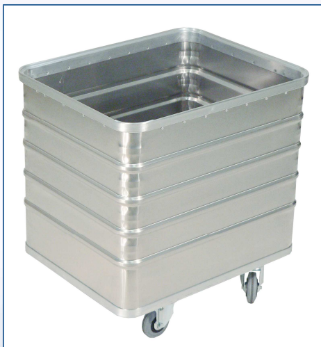
Transportwagen D 3008/235 B